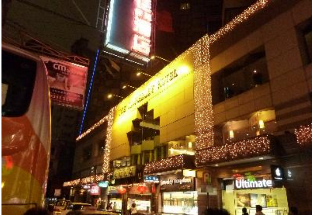
ホテル キンバリー 香港宿泊先