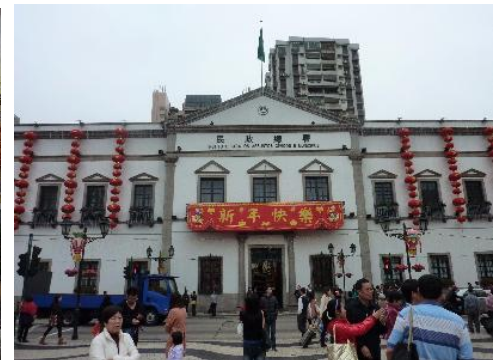
リアル・セナド(役場)