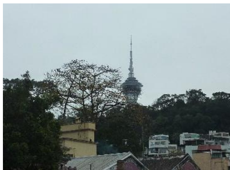
媽閣廟 から マカオタワーを望む