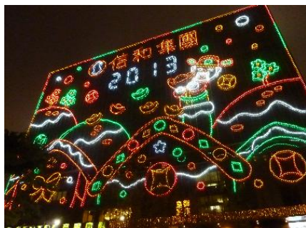
正月のイルミネーション