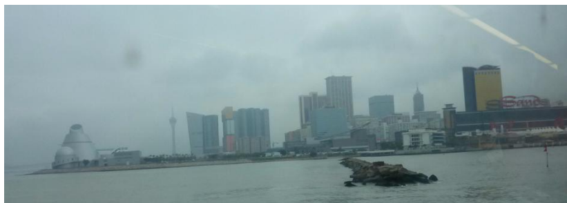
ジェットホイル で マカオにサヨナラ