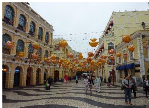
セナド広場(正月飾りが賑やか)