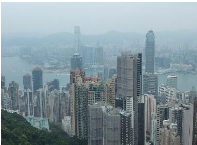
昼間のビクトリアピーク 再チャレンジ