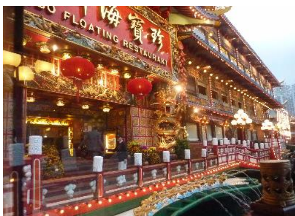
懐かしの海上レストラン JUMBO