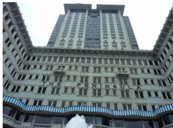
ペニンシュラ ホテル