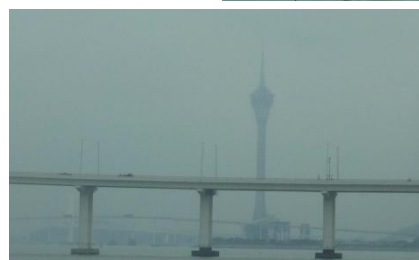
遠く マカオタワー