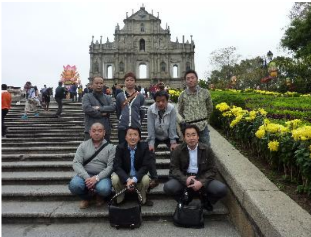
聖ポール天主堂跡