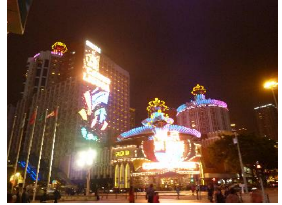
旧 ホテルリスボア+カジノ