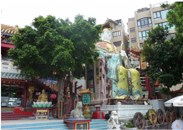
海の守り神 天后廟