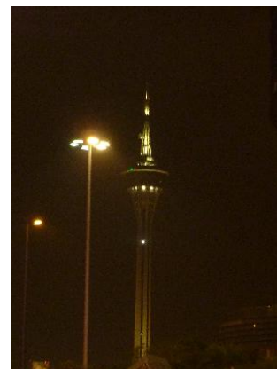
夜のマカオタワー