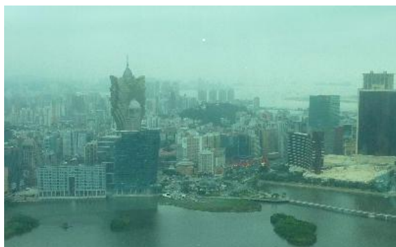
マカオタワーから